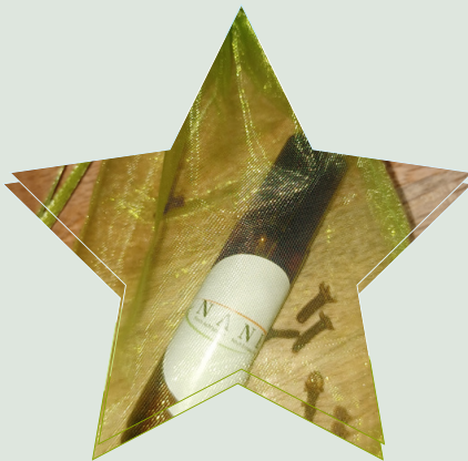
Ätherisches Öl als Roll-On