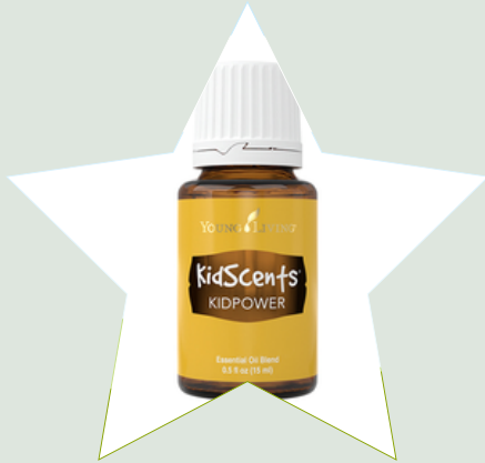
Ätherische Öle von Young Living *